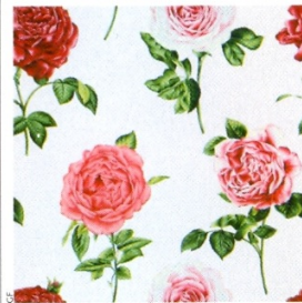
Hotpoints en Roses, werken van Mathew Cerletty.